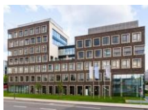
Immeuble KölnCubus (Cologne)

ACTIPIERRE EUROPE a acquis une participation de 13,8 M€ dans une SCI (quote-part de 20%) détenant un immeuble de bureaux dans l'un des principaux quartiers d'affaires de Cologne (Allemagne). L'investissement a été réalisé en indivision avec 3 SCPI et 1 OPCI grand public gérés par AEW et à la stratégie d'investissement compatible. Le transfert de propriété a été opéré le 1er janvier 2021.