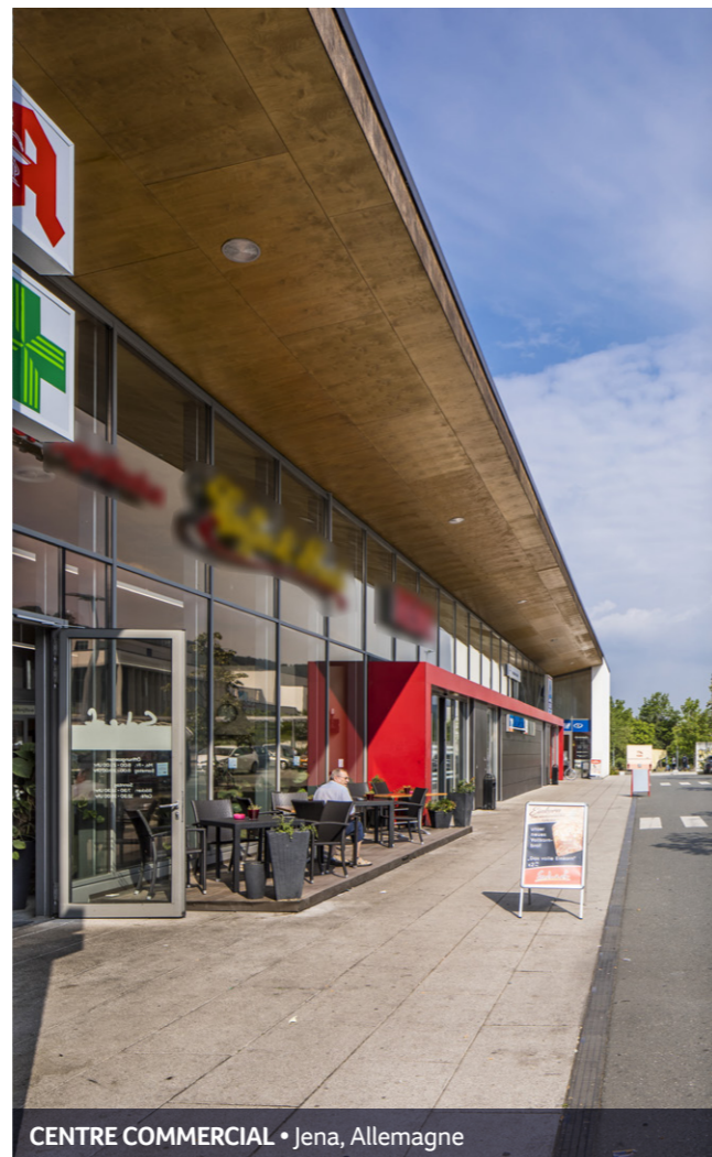
CENTRE COMMERCIAL • Jena, Allemagne

Année d'acquisition : 2011