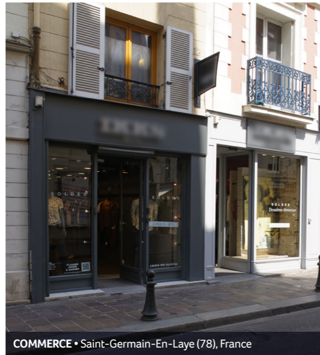
COMMERCE • Saint-Germain-En-Laye (78), France

Année d'acquisition : 2011