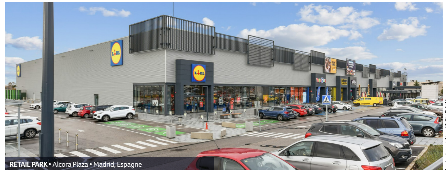
RETAIL PARK • Alcora Plaza • Madrid, Espagne

Année d'acquisition : 2018