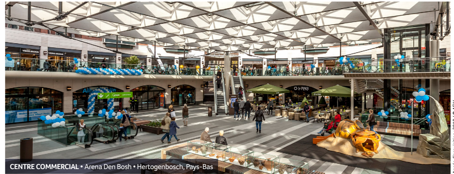
CENTRE COMMERCIAL • Arena Den Bosch • Hertogenbosch, Pays-Bas