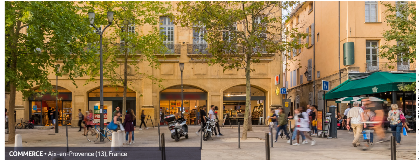
COMMERCE • Aix-en-Provence (13), France

Année d'acquisition : 2018